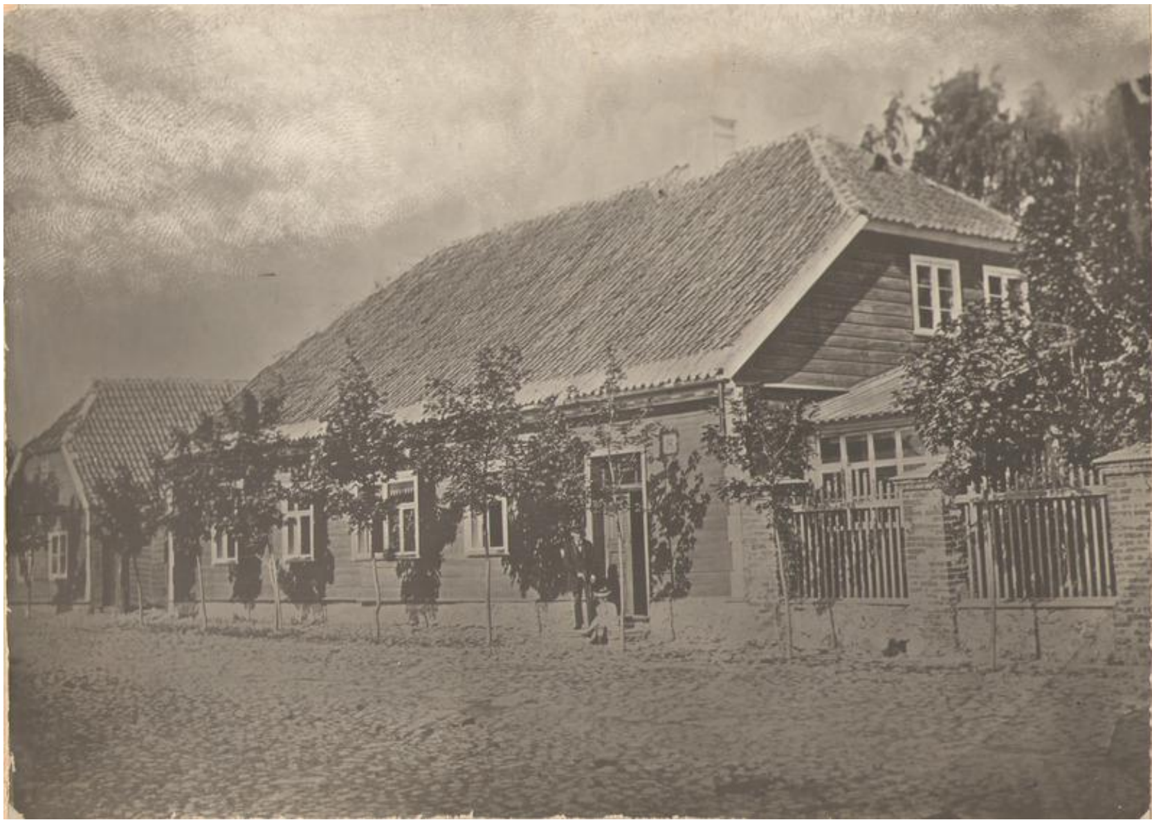
Fotol: Fr. R. Kreutzwaldi elumaja, lävel Fr. R. Kreutzwald.

Dr. Fr. R. Kreutzwaldi elumaja, kus praegu asub muuseum, on ehitatud 1793. a, üheksa aastat pärast Võru linna asutamist ja on seega üks esimesi ehitisi. Fr. R. Kreutzwald elas Võrus 44 aastat.