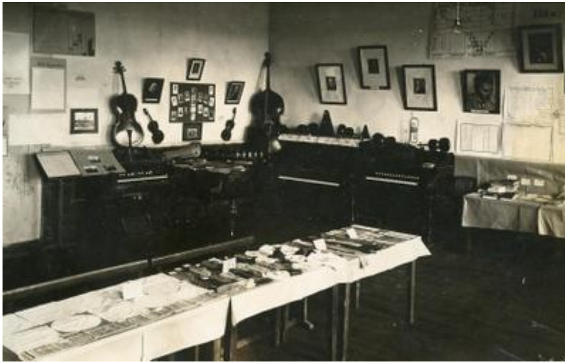
Õppevahendite näitus Võru Õpetajate Seminaris, 1927