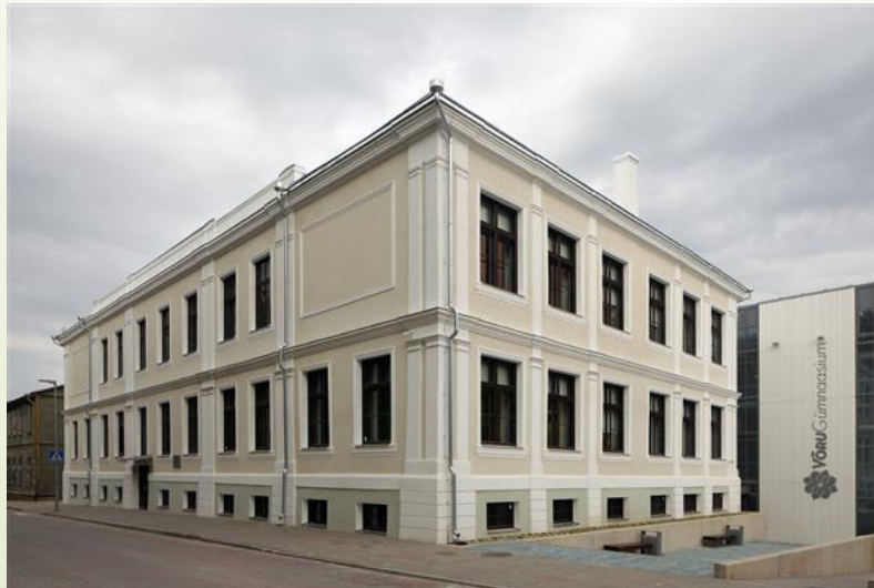
Võru Õpetajate Seminari hoones (1921-1930) asub täna Võru Gümnaasium